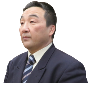
いのうえ こうじ 井上 弘治 議員