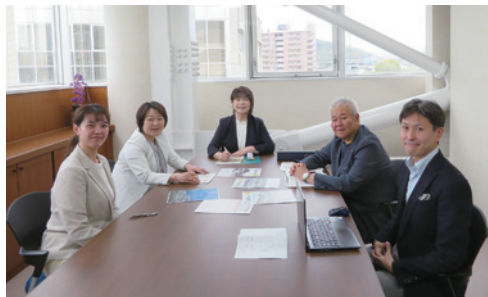
創刊100号に向け編集会議の様子