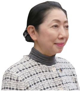
にしもと ゆうこ 西本 祐子 議員