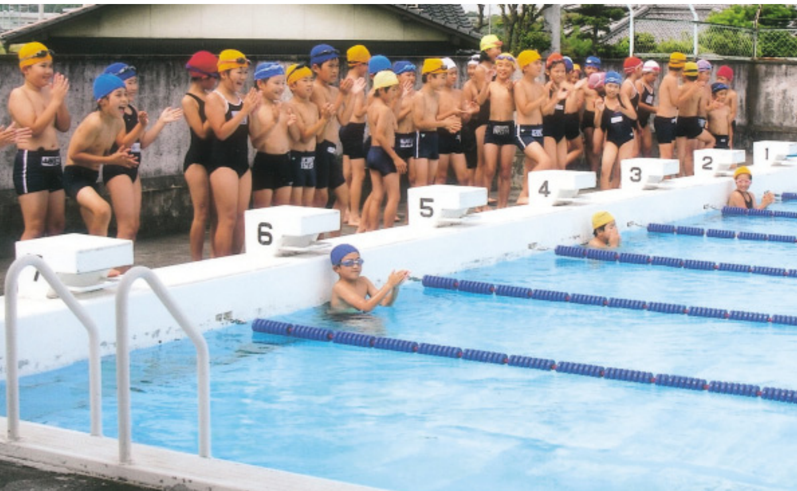
水泳大会（宇多津小学校）