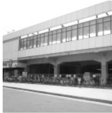
JR宇多津駅駐輪場建設予定地

〈内容〉歳入歳出それぞれ一、七八八万円を追加し、総額五四億四、〇六六八八万円とする