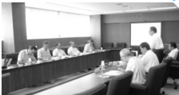
鳥取県北栄町議会の人達と