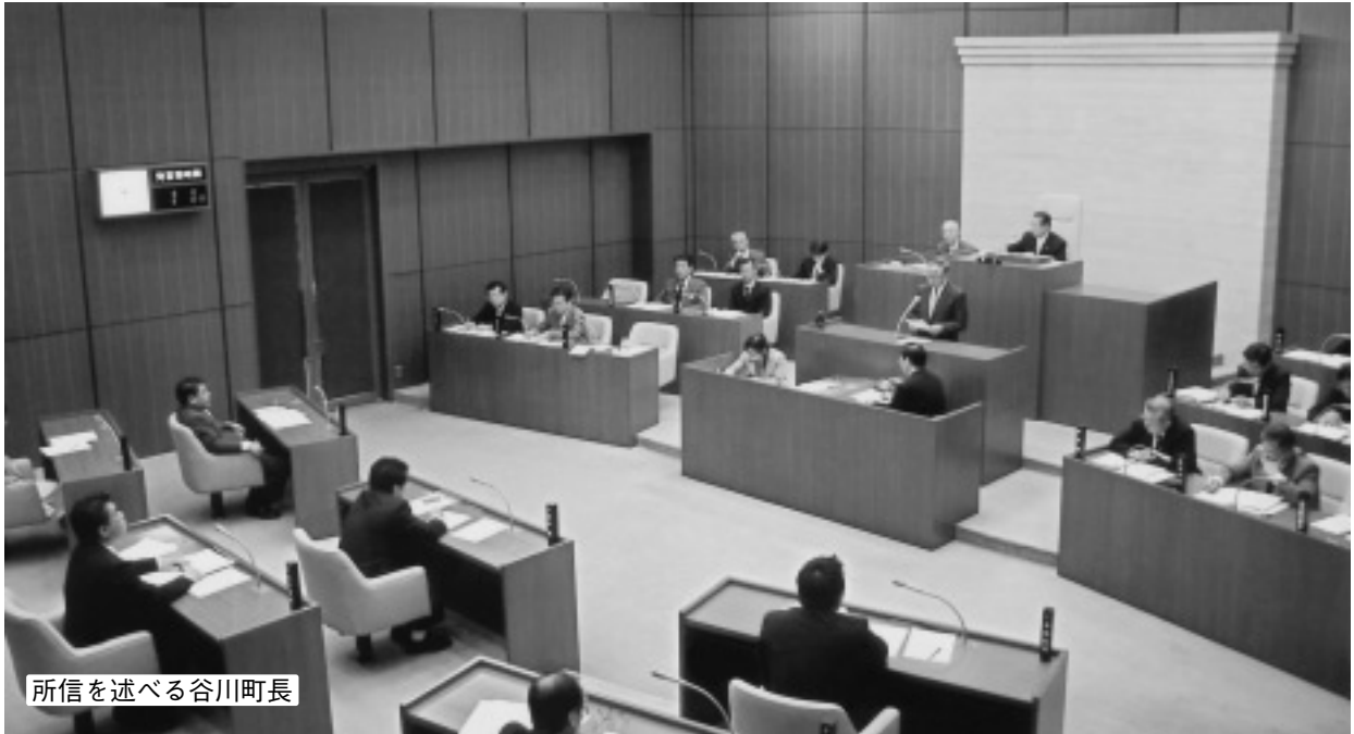
所信を述べる谷川町長

平成二十年第二回定例町議会は六月五日から六月十二日まで開催され、報告二件、承認二件、議案十三件、人事案件二件、陳情一件とその他一件は継続審議とした。また一般質問は日曜議会として行い九人が登壇「公立保育所の民営化について」「議会のインターネット中継について」「宇多津における農業について」「地デジ放送の難視世帯対策について」「後期高齢者医療について」「大東川の水環境について」「住宅介護実績記録端末（ピポ）の運用状況について」「教材費の充実と理科教育の充実強化について」「給食費の値上げと滞納実態について」などについて活発な議論が交わされた。