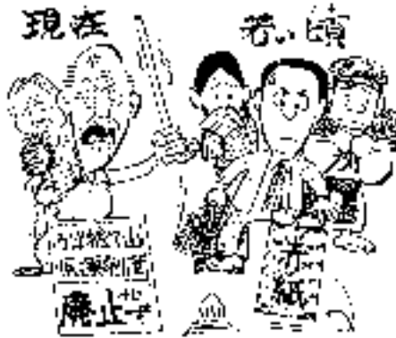
二度も、お国のために命をくれたと!! (マンガ・文は井原猛雄氏より)

後期高齢者の医療制度の問題は、ご趣旨をお伺いしますと、議会で論議をして、それで国に陳情されるか、要望されるかということをお決めになったらいかがでしょうか、そうお答えする以外にないと思います。