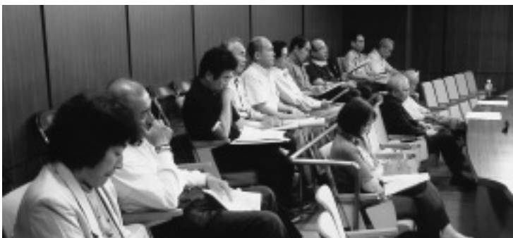
「日曜議会」熱心な傍聴者

〈内容〉町営住宅・駐車場(新開南団地内)の明渡し並びに滞納家賃・駐車場の使用料及び損害賠償金の支払いの各請求の訴えを提起するため