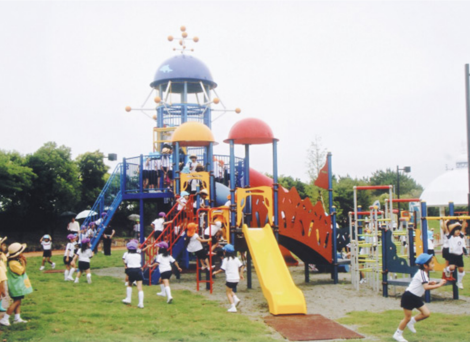
臨海公園 遊具広場