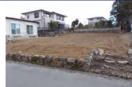
三重県津市(土地) 譲渡額約270万円