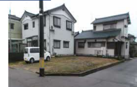
新潟県燕市(土地) 譲渡額約350万円