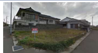
鹿児島県いちき串木野市(土地) 譲渡額約350万円