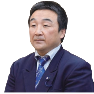
井上 弘治 議員