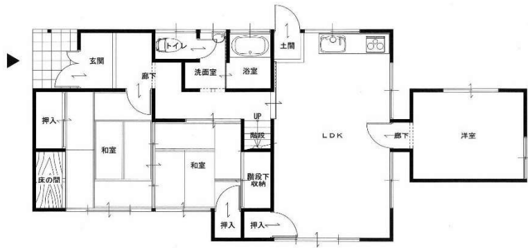
1階 平面図 S:1/50