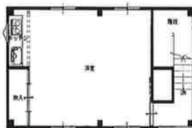
3階 平面図 S:1/100