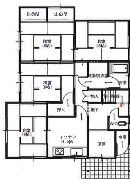
1階 平面図 S:1/100